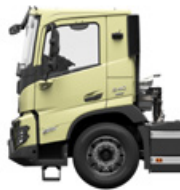
Низька денна кабіна