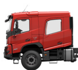
Кабіна з двома рядами сидінь